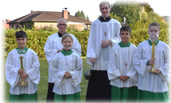
Eindrücke von der Wiedereröffnung der St. Andreaskirche in Sottrum am vergangenen Sonntag