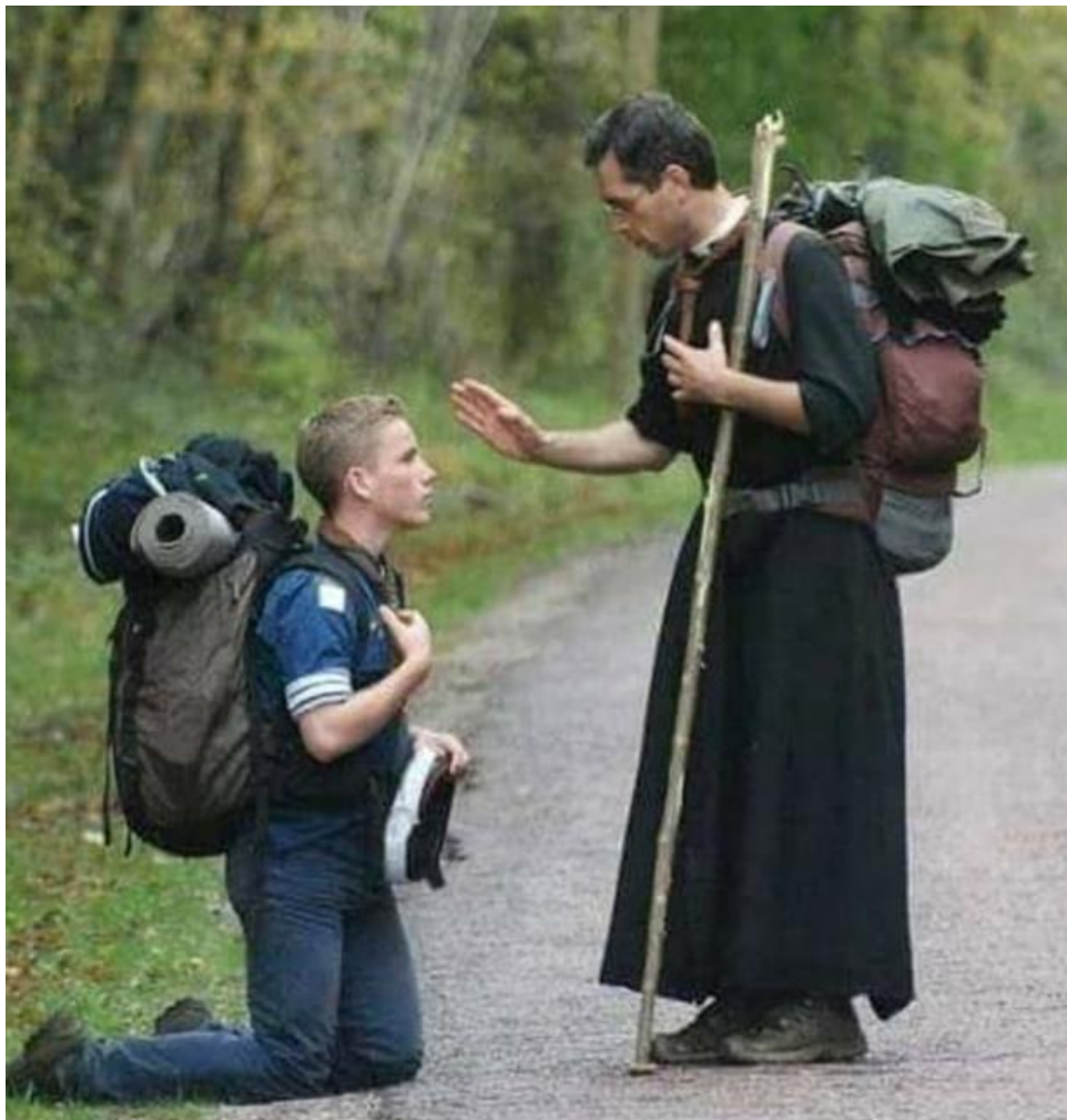
Am Rande des Pilgerweges nach Santiago de Compostela.