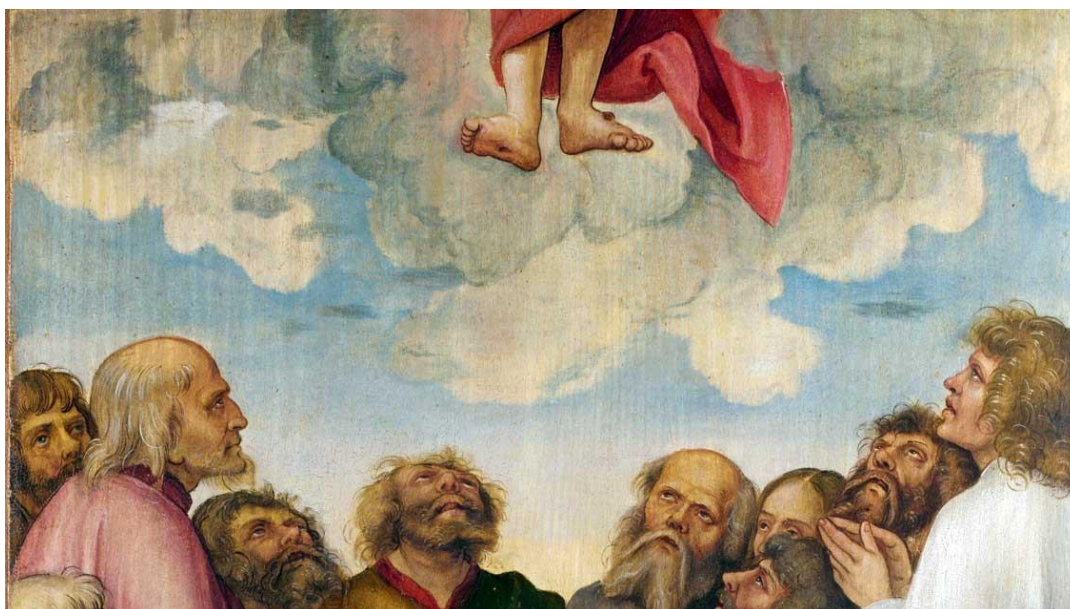
Detail aus einem Himmelfahrtsbild von Hans Sülz von Kulmbach, 1513