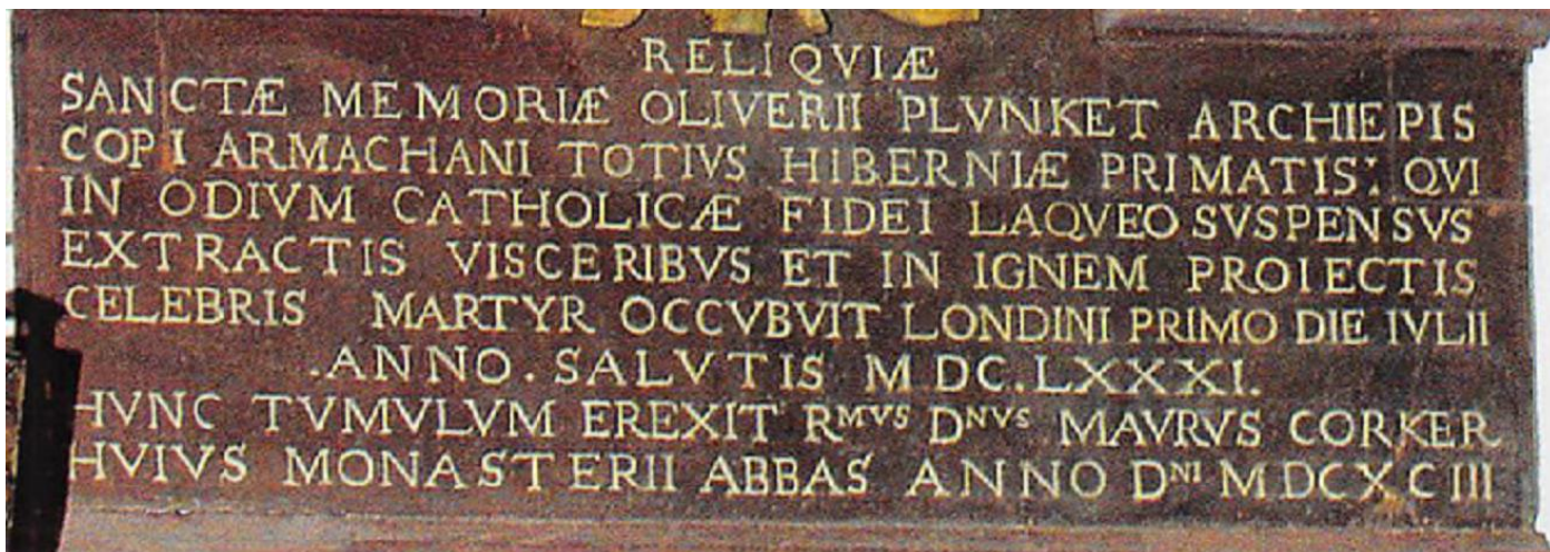
Dreimal Lamspringe: Memento-mori-Engel im Hoch-Chor, Wappen auf dem Schrein, und Inschrift am Reliquiengrab. Reicht Ihr Latein?