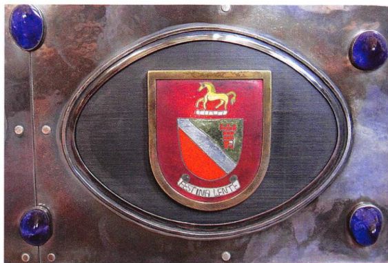
Wappen Oliver Plunketts mit seinem Wahlspruch FESTINALENTE (Eile mit Weile), Medaillon am Heiligsprechungsschrein von 1975