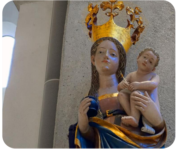
Die „Fintenfass-Madonna“ im Hildesheimer Dom

Jedes Lassen, jede Tat, Mutter, dir, vom guten Rat, leg ich alles in die Hände – du führst es zum rechten Ende. Amen.